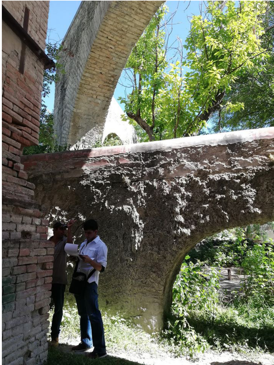
Imágenes 4 y 5. Visita de alumnos y profesores del taller interdisciplinar a Guadalcázar, San Luis Potosí, 2019.