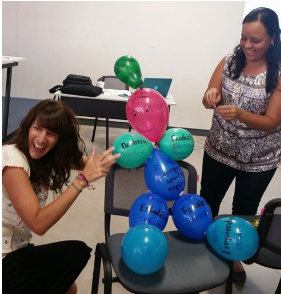
Imagen 1. Estudiante formado con globos.

de enseñanza aprendizaje para esta modalidad, además de ello se fortalecieron las relaciones humanas a través de actividades lúdicas en las que participaron los profesores con entusiasmo, asunto clave si se quiere trabajar de manera colaborativa. Se intercambiaron ideas y posturas críticas.