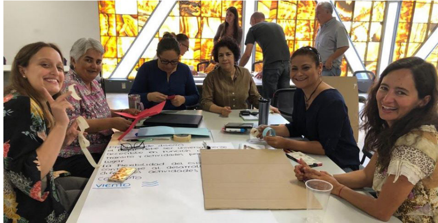
Imagen 3. Profesoras estableciendo las formas de trabajo del taller.

Se llevaron a cabo academias en las que se establecieron las formas de trabajo y de evaluación, se entregó a los profesores por parte del jefe de campo curricular, las rúbricas por etapa, no solo de los entregables ni de la forma de evaluar los contenidos, también se les proporcionaron rúbricas de autoevaluación para los estudiantes, los cuales no sólo se evaluaban entre sí, también establecían el desempeño de los profesores, en estas academias se analizaron las rúbricas y se hicieron ajustes que se aplicaron para todos. La idea que rigió la operatividad del taller fue el trabajo colaborativo e interdisciplinar desde su organización interna, siempre fue importante el aporte de todos los involucrados para que el taller se desarrollara adecuadamente. (ver imagen 3).