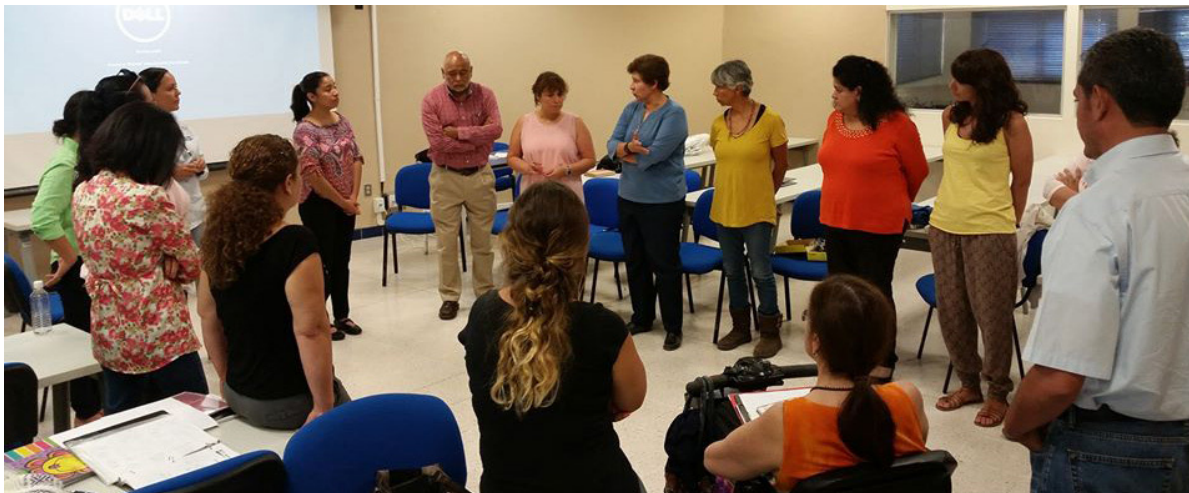
Imagen 2. Profesores en ejercicio de reflexión.

Se llevaron a cabo diversas dinámicas que permitieron clarificar la misión y la visión del profesor en el taller, una de ellas fue muy productiva, consistió en pedir a los profesores que representaran con globos a un estudiante y en cada una de las partes del cuerpo que formaron, pusieran lo que les gustaría que su alumno ideal tuviera como características, algunos pusieron: perseverante, dinámico, propositivo, creativo, etc., después de que establecieron todas estas cualidades, se pidió que lo pusieran al reverso y señalaran ahora que acciones tenían para obtener al estudiante que ellos querían, esto los hizo entender la importancia de su participación en el proceso. Los educandos y profesores, señalan Bilbao y Velasco (2014) asumen responsabilidades individuales. Cada participante es, y debe sentirse, responsable del resultado final del grupo. Se conecta y complementa al de interdependencia positiva. Sentir que algo depende de uno mismo y que los demás confían en la propia capacidad de trabajo aumenta la motivación. En la imagen 1 se observa a dos profesoras diseñando a su estudiante ideal, en la imagen 2 se observa a los profesores reflexionando sobre la experiencia de realizar la actividad.