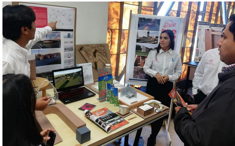
Imagen 6. Presentación de los proyectos a la comunidad.

En la etapa de materialización y para facilitar el proceso de conceptualización, a partir del diagnóstico los estudiantes establecieron premisas de diseño y plasmaron la idea que iba a regir el proceso. La elección de materiales y técnicas para representar el concepto fue libre, permitió a partir de ello, definir paletas de colores, formas, texturas y escalas con las que iban a trabajar. En paralelo a esto, se fue desarrollando el plan maestro en el que se establecieron estrategias de trabajo, alcances y cartera de proyectos. Una vez que se contó con todo este material, hubo nuevos acercamientos con la comunidad mostrando la cartera de proyectos para establecer jerarquías de abordaje de los mismos. Ver imagen 6.