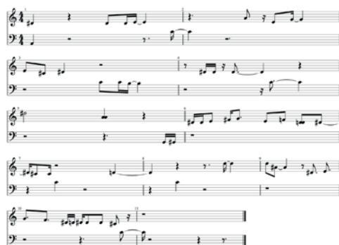
Figura 4. Composición de Edith en el trombón (balbuceo).