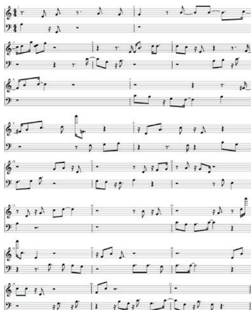
Figura 2. Composición de Edith en el piano.