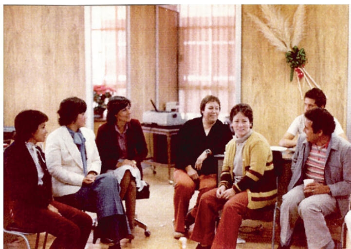
Reunión del personal de la Dirección de Finanzas en el Edificio Central de la UAA.