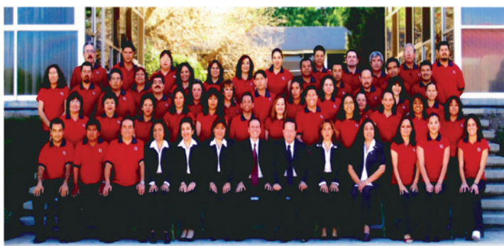
Dirección General de Finanzas 2005 Universidad Autónoma de Aguascalientes