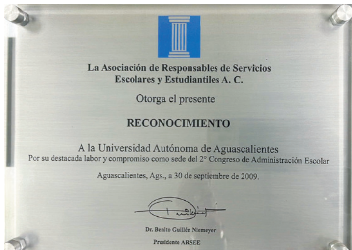
Reconocimiento a la UAA por el 2º Congreso de Administración Escolar. UAA, Aguascalientes, septiembre de 2009. APMERJ.

Con la firma de este convenio con la Dirección General de Profesiones (DGP) de la SEP, en la UAA también tuvimos que asumir la responsabilidad de verificar la autenticidad de los documentos que avalan los estudios previos de los egresados universitarios, de tal suerte que, para realizar el trámite del registro del título y la expedición de la cédula profesional, ya no fue necesario llevar físicamente estos documentos a la DGP. Esta delicada responsabilidad era anteriormente de la DGP, por lo que se hizo necesario crear una nueva sección dentro del Departamento de Control Escolar para realizar esta actividad, porque, con el fin de constatar que dicha autenticación fuera ejecutada de manera rigurosa, la DGP pedía, en ocasiones y de manera aleatoria, copia de los documentos de algunos expedientes para verificar la autenticidad de éstos.