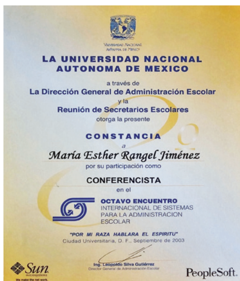
Constancia del Octavo Encuentro Internacional de Sistemas para la Administración Escolar. UNAM, Ciudad de México, septiembre de 2003. APMERJ.

kárdex de sus alumnos, lo que representaba tiempo, dinero y esfuerzo para el departamento. Sin embargo, comprendíamos que al tutor no le era fácil actualizar el kárdex de sus alumnos por el sistema departamental de la institución. Con el apoyo del Departamento de Orientación Educativa, responsable del programa de tutorías, desarrollamos una aplicación para que cada tutor, previa identificación, pudiera ver no sólo el kárdex de cada uno de sus alumnos, sino, además, datos sobre sus estudios previos, resultados del examen de admisión, su horario de clases, aulas y los nombres de sus profesores de cada materia. El objetivo fue que el tutor pudiera detectar posibles debilidades o riesgos en sus alumnos y los apoyara de una manera más eficaz. Esta aplicación la presentamos en el Octavo Encuentro Internacional de Sistemas para la Administración Escolar, organizado por la Dirección General de Administración Escolar de la Universidad Nacional Autónoma de México, celebrado en el entonces Distrito Federal en septiembre de 2003.