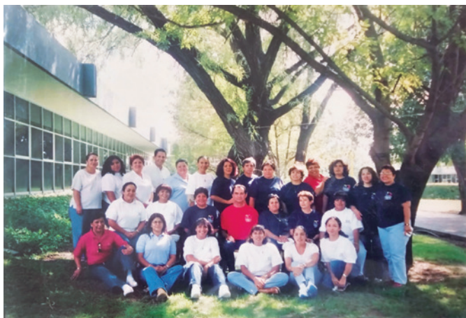
Fotografía del personal del Departamento de Control Escolar en los jardines fuera del edificio de Rectoría en el campus central de la UAA. APMERJ.

Finalmente, quiero agradecer infinitamente a todos y cada uno de los rectores y secretarios generales que ejercieron el cargo durante el tiempo que duró mi gestión al frente del Departamento de Control Escolar, por su amistad, la confianza y el respaldo que me brindaron; sin ello, no me hubiera sido posible llevar a cabo la labor que tenía encomendada y superar las metas propuestas en beneficio de nuestra gran institución. Igualmente, quiero manifestar que ejercer el cargo me brindó la oportunidad de tratar y convivir con muchísimas personas, internas y externas a la institución, con quienes compartí apuros y dificultades, pero también logros y alegrías, así como ideales y sueños, aunadas a muchas gratas experiencias de cariño y amistad. Por todo lo expresado, en esta celebración del 50 aniversario de la fundación de la Universidad Autónoma de Aguascalientes, todos y cada uno de quienes convivieron conmigo en esta etapa estarán siempre en mi corazón y en mi pensamiento.