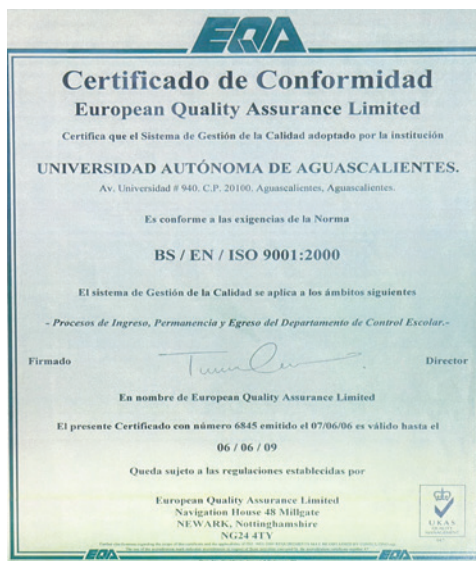
Certificado ISO 9001:2000. UAA, 2006-2009. APMERJ.

Igualmente, durante este periodo se les dio especial importancia a los posgrados. Se establecieron criterios tanto para su ingreso como para obtener la titulación, y se adecuó el reglamento. El objetivo fue que todos los posgrados que impartía la institución fueran reconocidos por el CONACYT (Consejo Nacional para la Ciencia y la Tecnología), dentro del Padrón Nacional de Posgrados de Calidad, para que quienes estudiaran dichos posgrados pudieran acceder a una beca.