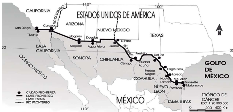
Figura 1. Principales ciudades fronterizas de México y Estados Unidos.

Como se observa en la figura 1, a lo largo de los 3,152 km de esta frontera norte se han desarrollado ciudades en ambos países, evidenciando la relación directa de éstos. Del lado mexicano, los estados de Baja California, Sonora, Chihuahua, Coahuila, Nuevo León y Tamaulipas; del lado estadounidense, California, Arizona, Nuevo México y Texas. 19