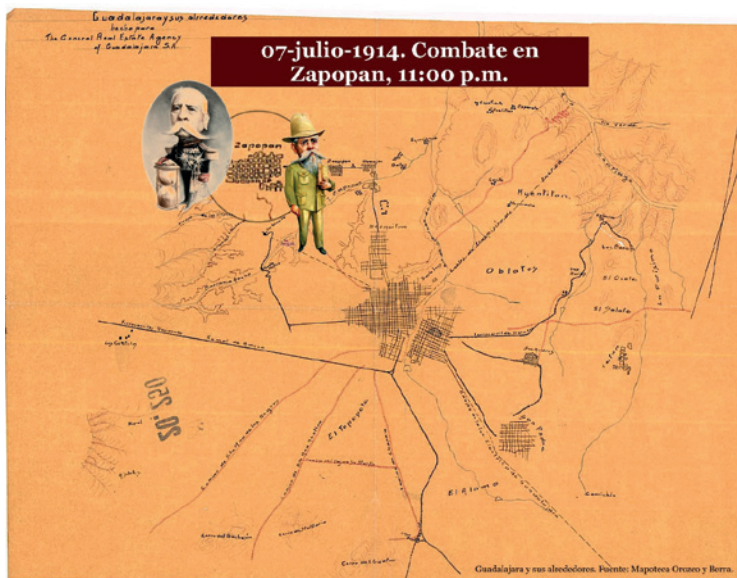
7.3 Combate en Zapopan, 1914. Elaborado por Rosa Isela Villarreal.