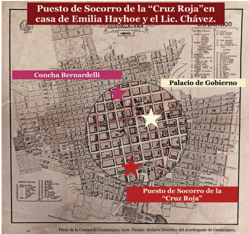
7.2 Puesto de socorro de la “Cruz Roja”. Fuente: Archivo Histórico del Arzobispado de Guadalajara. Elaborado por Rosa Isela Villarreal.