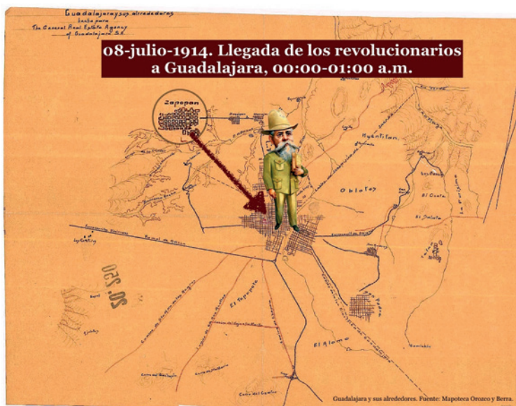
7.4 Llegada del Ejército Revolucionario a Guadalajara, 8 de julio de 1914. Elaborado por Rosa Isela Villarreal.