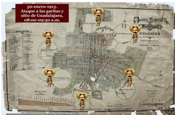
7.6 Ataque a las garitas y sitio de Guadalajara. Fuente: Archivo Histórico de Jalisco (AHJ). Elaborado por Rosa Isela Villarreal.

logros educativos de una de sus hijas y su empeño por cultivar su intelecto. Como madre y viuda debía administrar adecuadamente su tiempo y esfuerzo.