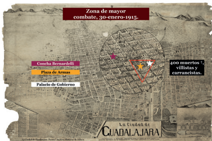
7.7 Zona de mayor combate entre carrancistas y villistas. Fuentes: Archivo Histórico de Jalisco (AHJ). Elaborado por Rosa Isela Villarreal.