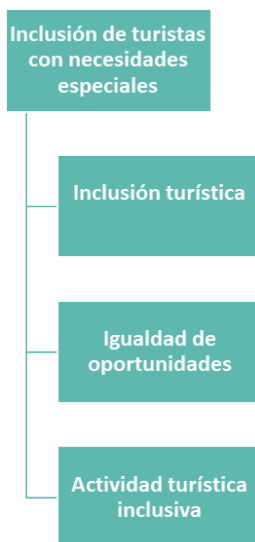
Figura 1. Inclusión de turistas con necesidades especiales