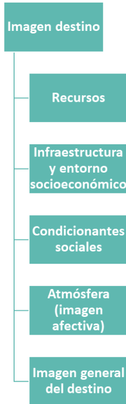
Figura 2. Imagen destino