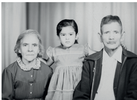
Figura 12. Toma fotográfica realizada por Armando de Luna Pedroza en 1958. Archivo de Armando de Luna Gallegos, positivada por GIMS.

Hay que afirmar, además, que los retratos del Estudio Fotográfico De Luna no se reducen a la idea estereotipada de la publicidad para la familia mexicana, ya que las fotografías contienen diferentes niveles de los vínculos familiares. Son diversas ante la idea actual de colocarles como formas visuales comunes y simples dentro del comercio fotográfico. Si bien no podría afirmarse que los fotógrafos De Luna persiguieron la intención de dejar manifiesto en su trabajo las transformaciones en las familias, aun siendo evidente que hubo la determinación para hacer búsquedas estéticas, lo que resultó de su deseo de construir imágenes armónicas, fue que las transformaciones ocurridas durante el siglo anterior a las familias se conjuntaron con las soluciones compositivas, las que finalmente también se vieron modificadas y enriquecidas. Se presentan a través del retrato las formas de interacción según los diferentes roles y las edades de las personas.