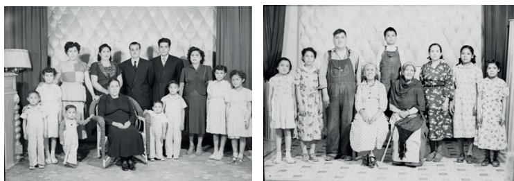
Figura 9. Tomas fotográficas realizadas por Antonio de Luna Medina en 1949, y por Armando de Luna Pedroza en mayo de 1953. Archivo de Armando de Luna Gallegos, positivadas por GIMS.

Al analizar las tendencias y las anomalías en las imágenes fotográficas de las familias, se subraya la idea de que se trata de un espacio de interacción y convivencia. 91 Se ha observado que los fotógrafos De Luna buscaron comunicar unidad y componer de acuerdo con el lugar que para cada miembro se pensaba dentro de su ámbito familiar. Con Antonio de Luna y su hijo Armando de Luna P., las fotografías resultantes se relacionan con la vida privada, ya que en las más, se recreaba la imagen del interior de las casas habitación. Gracias a los trabajos de Sosenski y López León se puede comparar el resultado de sus investigaciones acerca de las imágenes publicitarias para la ciudad de México, con las fotografías De Luna. Estos autores afirman que las imágenes publicitarias en la prensa gráfica, seguían