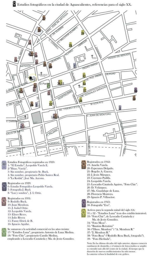
Figura 1. Mapa del centro de la ciudad de Aguascalientes, para ilustrar la presencia de los foto-estudios establecidos en el siglo xx a