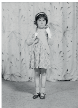
Figura 5. Toma fotográfica realizada por Armando de Luna Pedroza en marzo de 1968. Archivo de Armando de Luna Gallegos, positivada por GIMS.

Cada uno de los tres fotógrafos tuvo formas particulares para percibir a la infancia a través de la cámara, lo cual es observable en los signos formales más evidentes, como son los medios para iluminar, el manejo de los planos y los puntos de vista, la asimilación de los medios tecnológicos, al punto de poder concebir imágenes anómalas; mas todas ellas se relacionan con las maneras de comunicarse con los niños a través de la cámara, que resultan en significaciones para la infancia.