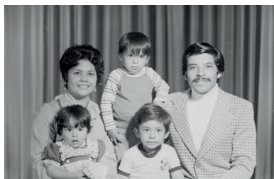
Figura 10. Tomas fotográficas realizadas por Armando de Luna Gallegos en febrero de 1978 y agosto de 1998, respectivamente. Archivo del mismo fotógrafo, digitalizadas en positivo y negativo por GIMS.