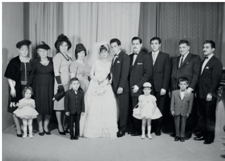
Figura 11. Toma fotográfica realizada por Armando de Luna Pedroza en agosto de 1963. Archivo de Armando de Luna Gallegos, positivada por GIMS.

Ambos fotógrafos, en sus composiciones, dieron centralidad a la figura de las novias; este gesto, aunado a lo característico de sus trajes blancos con la silueta marcada, las lleva a ser