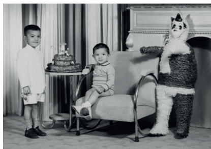
Figura 3. Díptico con tomas fotográficas realizadas por Armando de Luna Pedroza en diciembre de 1958, y por Armando de Luna Gallegos en marzo de 1978, respectivamente. Archivo de Armando de Luna Gallegos, positivadas por GIMS.