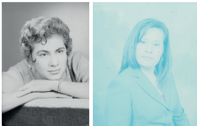
Figura 6. Tomas fotográficas realizadas por Armando de Luna Pedroza en mayo de 1958, y por Armando de Luna Gallegos en enero de 2008, respectivamente. Archivo de Armando de Luna Gallegos, positivadas por GIMS.

También la imagen de las mujeres, al fin cambiante, incluyó en las fotografías de las últimas décadas de producción de negativos, una relación con el mundo profesional a través del vestuario, lo que da lugar a pensar que, aunque no hay en este universo de imágenes aquellas que sean representativas de los movimientos políticos, presentan transformaciones en las actitudes de las mujeres ante la cámara, siendo gestos con mayor libertad en el ámbito del foto-estudio.