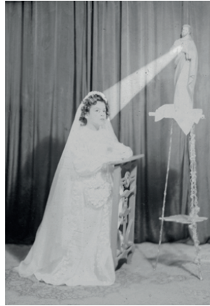
Figura 4. Toma fotográfica realizada por Antonio de Luna Medina en enero de 1948. Archivo de Armando de Luna Gallegos, positivada por GIMS.

Son múltiples las miradas fotográficas para los menores y sus problemáticas; 58 las que dieron lugar a este trabajo comunican en sentido general el sitio especial de la infancia en el medio fotográfico, mostrando maneras en las que se ha ido imaginando a la misma, involucrando celebraciones y el juego dramático. Los fotógrafos De Luna, quizá como parte de su quehacer, o quizá conscientemente fueron dando espacio a la relación entre la cámara y los niños/as, incluyendo a la mirada empática, o despertando una mayor comunicación de los menores ante la lente.