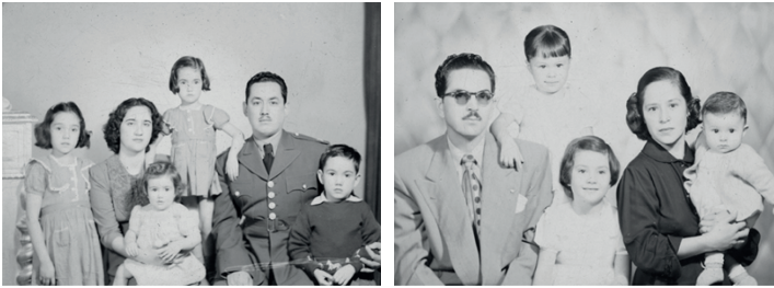
Figura 8. Tomas fotográficas realizadas por Antonio de Luna Medina en enero de 1948, y por Armando de Luna Pedroza en agosto de 1952. Archivo de Armando de Luna Gallegos, positivadas por GIMS.

Las composiciones resueltas por los fotógrafos se hicieron preferentemente colocando a los niños al centro de la imagen, con los padres sentados a los extremos, lo que hace sobresalir a la pareja como las figuras principales, y coloca a los niños como seres que requieren cuidados, esto último en ocasiones se refirió colocando a los niños del lado de las madres o de sus abuelas; mientras las figuras paternas seguían la imagen del proveedor, que se afirmó ante la lente de De Luna Pedroza con los hombres portando fistoles en la solapa.