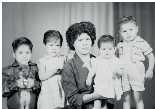
Figura 7. Toma fotográfica realizada por Armando de Luna Pedroza en octubre de 1963. Archivo de Armando de Luna Gallegos, positivadas por GIMS.

Con lo que respecta a los retratos de mujeres e infancia, las principales transformaciones se verían en correspondencia con los cambios demográficos, con las ideas sobre la maternidad, o con el control del crecimiento poblacional, en ese sentido con las acciones que las mujeres llevaron a cabo como parte de su participación social.