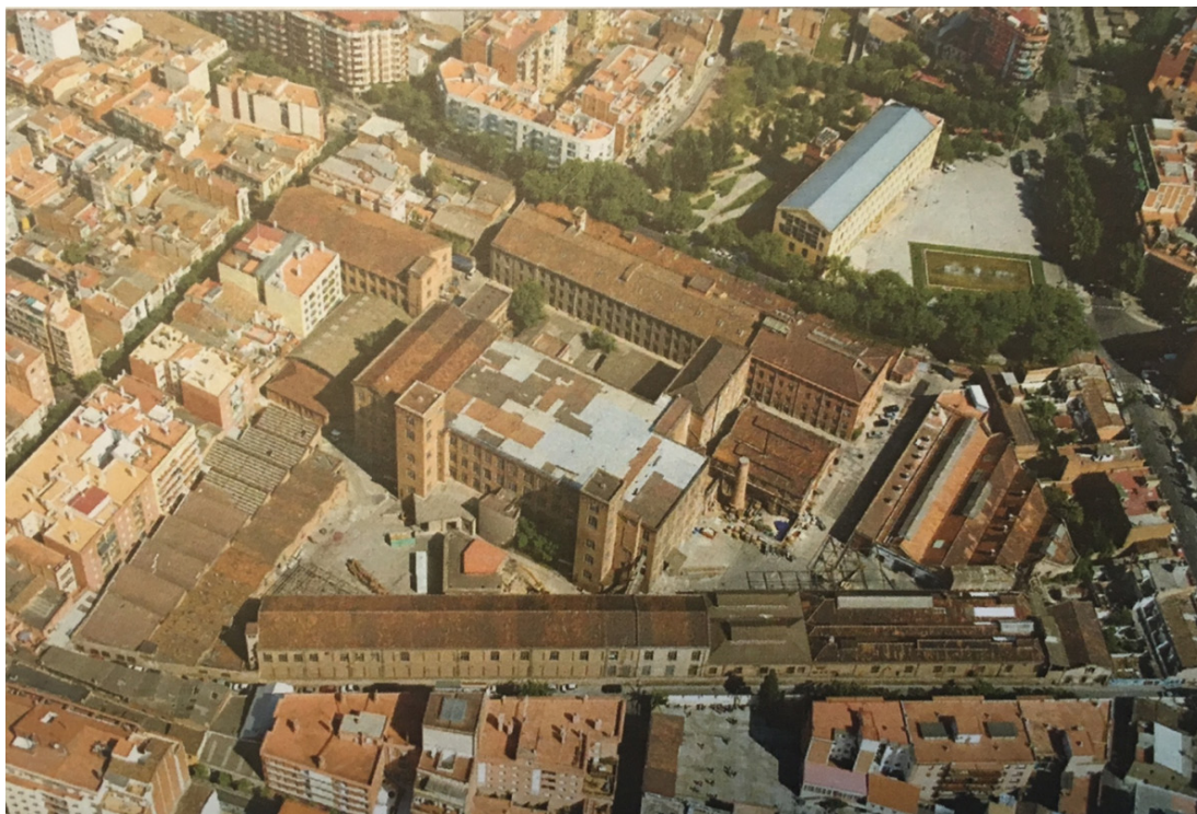
Figura 9. El recinto industrial de la Fabra y Coats, año 2010.

A partir de este momento se abrieron varios procesos participativos de la ciudadanía que contribuyeron a definir el uso futuro de la instalación. Una fecha decisiva fue el 20 de abril de 2006 cuando las calles interiores de Can Fabra (como se conoce actualmente el espacio), se abrieron por primera vez a todos los vecinos.