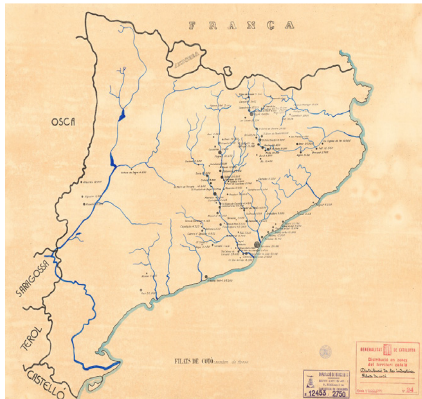
Figura 1. Catalunya, distribución de las industrias de hilados de algodón, 1932. Rubió i Tuduri, N. Institut Cartogràfic i Geològic de Catalunya. RM 243867.

La Figura 1 nos presenta la distribución de la industria de hilados de algodón en Catalunya en 1932, atendiendo al número de husos instalados. Se aprecia claramente su distribución a lo largo del curso de los ríos Llobregat y Ter y, sin embargo, también la pervivencia de un núcleo importante en la ciudad de Barcelona.