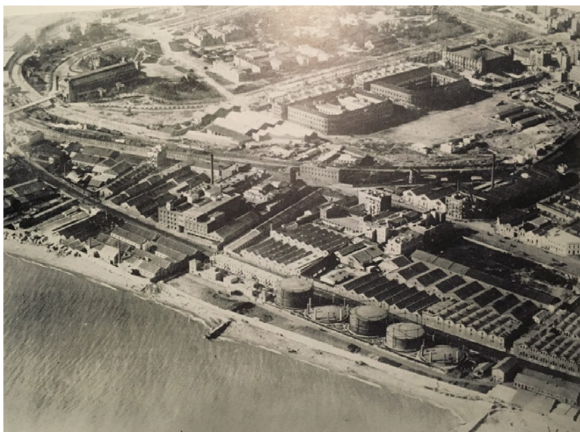
Figura 5. Playas del Poble Nou, años 80. Arxiu Històric del Poble Nou (1990), p. 54.

A principios de los años 80, la línea de la costa de Barcelona –que se extendía desde el antiguo barrio de la Barceloneta en el distrito de Ciutat Vella, hacia el noreste, hasta la desembocadura del río Besòs–, vivía de espaldas al mar: casas de baños, almacenes industriales, el trazado del ferrocarril, impedían el acceso a la costa (Figura 4). Esta situación cambió radicalmente a raíz del “Plan Especial de Ordenación Urbana de la Fachada Costera de Barcelona”, aprobado en 1986 (Cuyas, R., 1992). Dicho plan preveía la construcción en esta zona costera de la ciudad, de una nueva área que debía ser utilizada como Villa Olímpica, para alojamiento de los deportistas, y que después de los juegos debería destinarse para usos residenciales. También contemplaba la recuperación de la costa y la reordenación de los enlaces ferroviarios que atravesaban la zona.