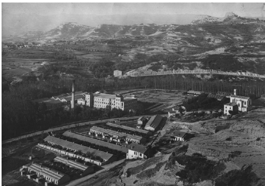
Figura 2. Colonia industrial de Borgonyà (1996), en Sant Vicenç de Torelló.

La Figura 2 nos presenta la colonia industrial de Borgonyà, propiedad de la empresa Fabra y Coats, en las orillas del río Ter en el municipio de Sant Vicenç de Torelló. En ella se pueden apreciar los elementos característicos de estos emplazamientos: el ferrocarril, que permitía la llegada del algodón, el río trazado por la hilera de chopos, la fábrica, el pueblo a su alrededor, la Iglesia en la colina y, aunque parezca un contrasentido, la chimenea, pues el carbón debía suplir la fuerza del agua en los periodos de sequía.