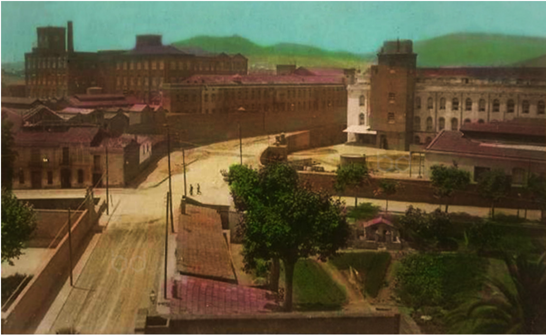
Figura 7. Fabra y Coats a inicios del siglo xx. En la parte izquierda de la postal se aprecia perfectamente la chimenea y el edificio central de la fábrica.

La Fabra y Coats (Figura 6) fue el fruto de la alianza en 1903 de dos familias industriales: los Fabra y los Coats. Los Fabra, catalanes, eran minoritarios pero se ocupaban de forma directa de la gestión de la sociedad; los Coats, escoceses, ostentaban la mayoría y ajustaban, en buena sintonía con sus socios locales, la estrategia de la sociedad catalana a la del grupo escocés. A principios del siglo xx, la Fabra y Coats era la primera empresa textil española, y el grupo Coats, al cual pertenecía, era nada más y nada menos que la tercera empresa industrial del mundo, por detrás de la US Steel y la Standard Oil.