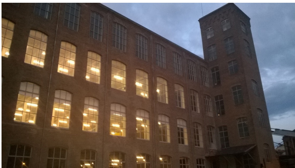
Figura 10. La nave central de la Fabra y Coats (2015).

El MUHBA, consciente de la potencialidad de cada uno de estos elementos, inició un conjunto de acciones dirigidas a desarrollarlos y divulgarlos.