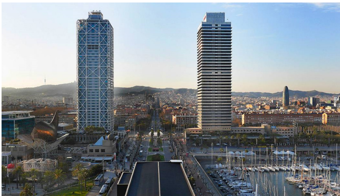
Figura 6. Zona Puerto Olímpico, Poblenou, después de la intervención urbanística de las Olimpiadas 92.

indiferencia, respecto el patrimonio industrial barcelonés y se realizaron sin ninguna atención al patrimonio industrial y urbanístico que se estaba viendo afectado (Figura 5).